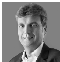
Thomas Dietrich Raiffeisen Centrobank AG